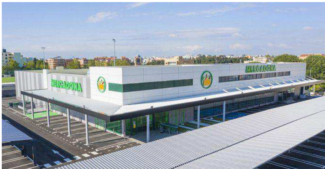
Exterior primera tienda de Mercadona en Portugal en Vila Nova de Gaia, Oporto.

La llegada de Mercadona a Portugal se ha convertido en una auténtica amenaza para sus rivales. Con cuatro supermercados –y la previsión de alcanzar diez– Mercadona ha agitado el mercado minorista del país vecino generando una lucha de precios para poder competir con su marca blanca.